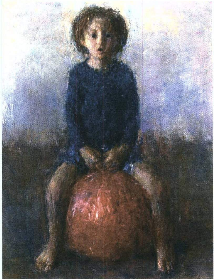
ENKAOUA. 'Natan et le ballon rouge', uno de los óleos que exhibe el artista.