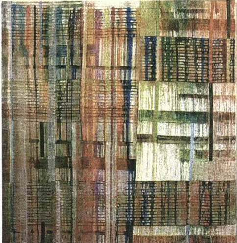
PÉREZ-PORRO. Una de las telas berlinesas del Espai Volart.

LA FUNDACIÓ VILA CASAS VUELVE A APOSTAR POR LA PINTURA EN SU NUEVA TEMPORADA: PRESENTA UNA RELECTURA DE LA COLECCIÓN EN CAN FRAMIS Y LA OBRA DE PÉREZ-PORRO Y ENKAOUA EN EL ESPAI VOLART